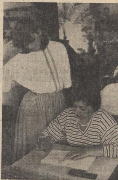
Test zawierał trzydzieści trzy pytania. W zgodnej opinii — bardzo trudne.