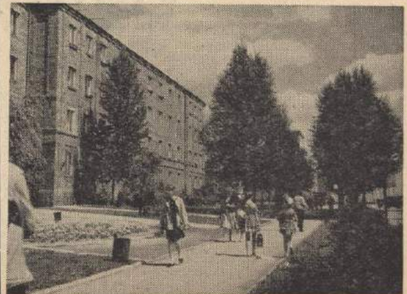
...przy głównej ulicy Sławińskiego rosty młode drzewka...