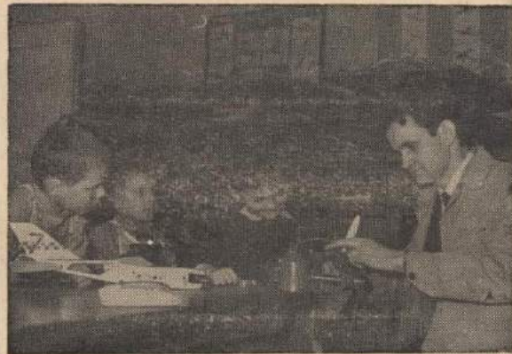
Działająca przy Aeroklubie Robotniczym w Świdniku sekcja modelarstwa lotniczego sprawdziła nawet i dla maluchów.