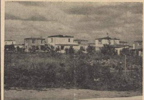
...a wzdłuż torów kolejowych rozbudowywało się osiedle domków jednorodzinnych.