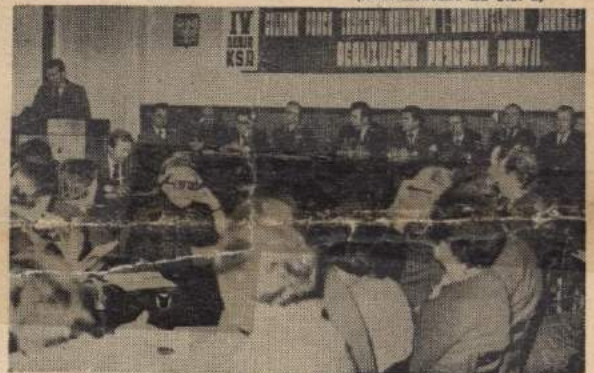
Sala obrad IV Sesji KSR