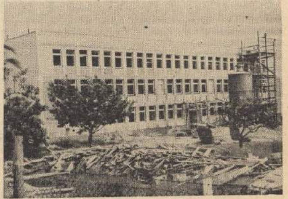
Tak wyglądała w budowie przychodnia miejska...