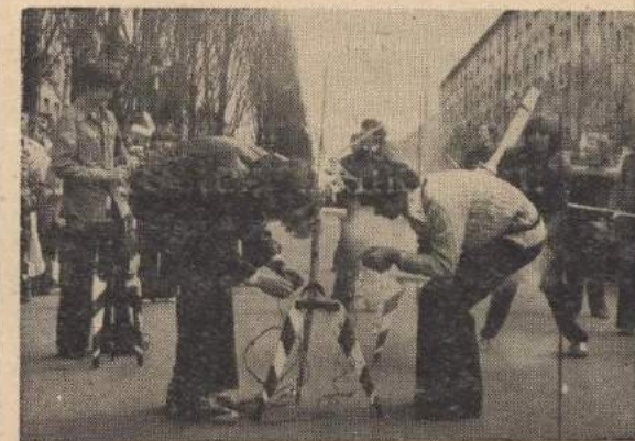
Ta dyscyplina sportu nie tylko kształci i rozwija zdolności konstruktorów, ale jest również niezwykle widowiskowa.