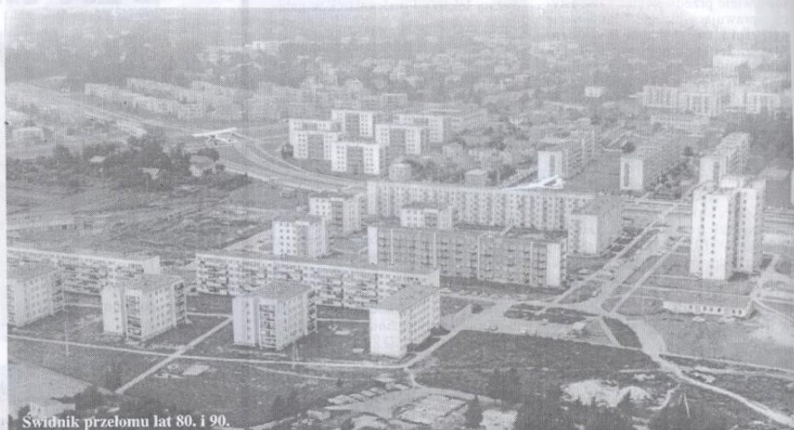
Świdnik przełomu lat 80. i 90.

W nowo otwartym pawilonie "Rywal" na Króla Polu "wszystkie futra z włosiem na zewnątrz, odzież licową oprócz futer z lisa powyżej 40 tys. złotych" można było kupować na 24 raty. W dniu otwarcia kolejnego pawilonu, tym razem na osiedlu "Lotnicze", najbardziej rozkupowanym towarem była kawa. Urząd z pierwszego dnia sprzedaży obliczono na 3 mln zł, a miesięczny koszt utrzymania pawilonu wynosił 250 tys. zł. Ogólna powierzchnia użytkowa wszystkich placówek handlowych w Świdniku osiągnęła 13 386 mkw.