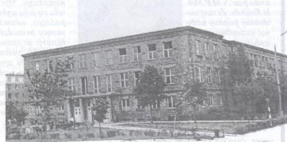
Pierwsza świdnicka placówka oświatowa mieściła szkołę podstawową i liceum ogólnokształcące

Pierwszym znaczącym wydarzeniem roku 1986 było otrzymanie przez śmigłowce PZL "Kania" krajowego świadectwa typu. W maju pracownicy Szydłowieckich Zakładów Kamienia