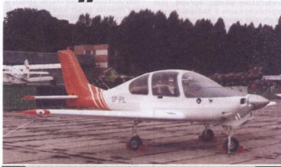
I-23 Manager podczas prezentacji z okazji 70 - lecia Szkoły Orliąt w Dęblinie pod koniec sierpnia 1998 roku.