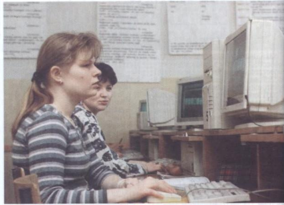
W nowoczesnie wyposażonej pracowni komputerowej uczniowie uczą się informatyki.

Wszystkie osiągnięcia i sukcesy to wspólny dorobek młodzieży i ich nauczycieli, którzy razem przez lata budowali jej oblicze. Przy okazji świętując chwałę się swoimi wychowankami osiągnięciami w życiu zawodowym sukcesy. Wśród 3600 absolwentów jest wielu doskonałych fachowców zajmujących się prawie wszystkimi dziedzinami życia. Między innymi absol-