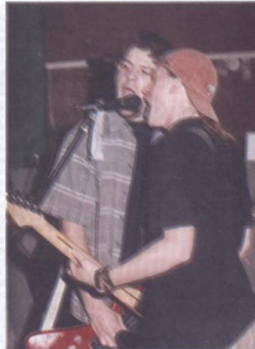
Oprawę muzyczną tegorocznej Orkiestry powierzone Świdnickim zespołom rockowym. Usłyszeliśmy chyba wszystkie ważniejsze gatunki tego rodzaju muzyki - między innymi metal, grunge i punk. Dynamiczne rytmy i gitarowe rify natychmiast porwały do wspólnej zabawy wszystkich sympatyków Wielkiej Orkiestry Świątecznej Pomocy.