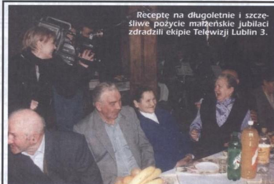
Receptę na długoletnie i szczęśliwe pożycie małżeńskie jubilatów zdradzili ekipie Telewizji Lublin 3.