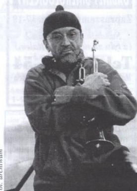
Stywny trębacz Tomasz Stańko wystąpi w Świdniku w sobotę, 28 października.