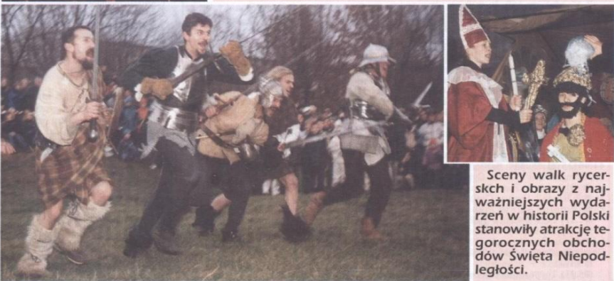
Sceny walk rycerskich i obrazy z najważniejszych wydarzeń w historii Polski stanowiły atrakcję tegorocznych obchodów Święta Niepodległości.