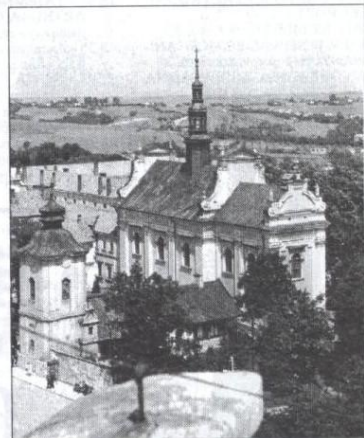
Listopadowym. Do kościoła św. Pawła wiedeńskie wawóz Piszczelce, nazwany tak z racji znalezienia w nim dużej ilości kości ludzkich. Kościół pierwotnie gotycki ma naleciałości renesansowe