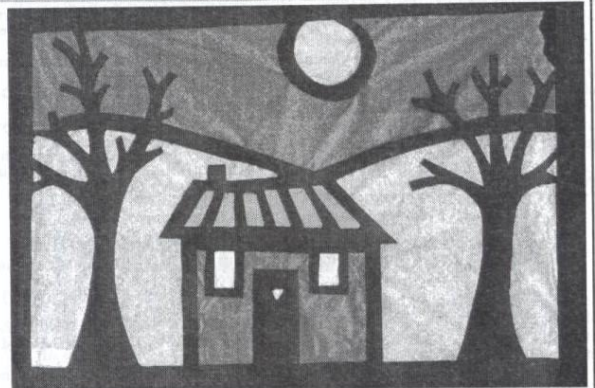
Ta wyklejanka powstała podczas zajęć w Dziennym Centrum Aktywności.