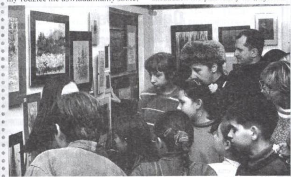
Piątkowa wystawa w Miejskim Ośrodku Terapii przyciągnęła ogromne rzesze zwiedzających.

że przez cały czas jesteśmy świadkami tego procesu. Dopiero kiedy porównujemy wystawy, analizujemy prace powstałe w okresie kilku lat, to widzimy wyraźnie jak coraz wyższe progi pokonują ich autorzy. Organizatorzy wystawili tym razem 310 prac, głównie pejzaży, które powstały w Preukach, małej wiosce, leżącej niedaleko Komańczy.