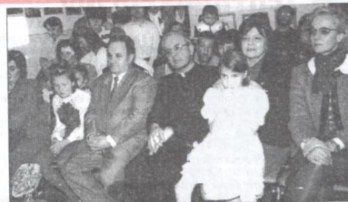
Księżna Irina (pierwsza z prawej) obejrzała występ podopiecznych stowarzyszenia i obiecała przyjechać w lutym, by sfinalizować zakup sprzętu do rehabilitacji.