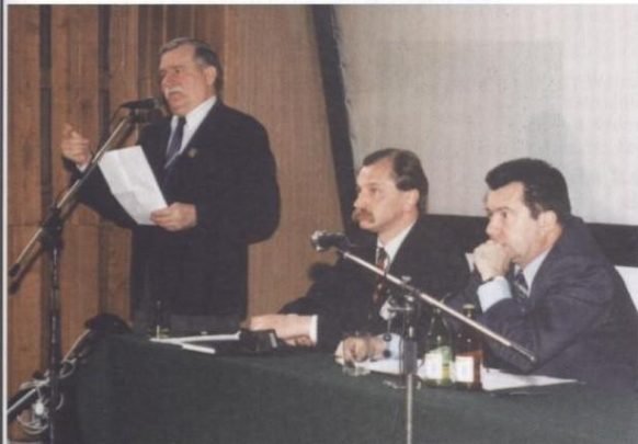
Zgromadzenie Wojewódzkie ChDRP w Lublinie, 2 maja 1998r.

solwentów wyższych uczelni. Pierwsze koła powstały wśród studentów UMCS i KUL. Kolejne wśród pracowników AR w Lublinie. Powołanie Grupy Inicjatywnej odbyło się w kwietniu 1998 roku. Ludzie pracujący w jej składzie nadali nowego impetu w powstawaniu struktur. Największy odźwięk był wśród pracowników PL gdzie powstało kilka dużych kół. W szybkim czasie spełnione zostały wymagania określone w Statucie do zwołania Zgromadzenia Wojewódzkiego. W powołano sześć okręgów, które wybrały i ukonstytuowały władze oraz wyraziły wolę zwołania Zgromadzenia Wojewódzkiego. Jego przeprowadzenie zaplanowano na dzień 2 maja. Z tej okazji zaplanowano również w tym dniu wizytę Lecha Wałęsy, która miała podkreślić ważność powstania kolejnej, drugiej co do wielkości w tym momencie, dziesiątej już, wojewódzkiej struktury Chrześcijańskiej Demokracji III Rzeczypospolitej Polskiej.