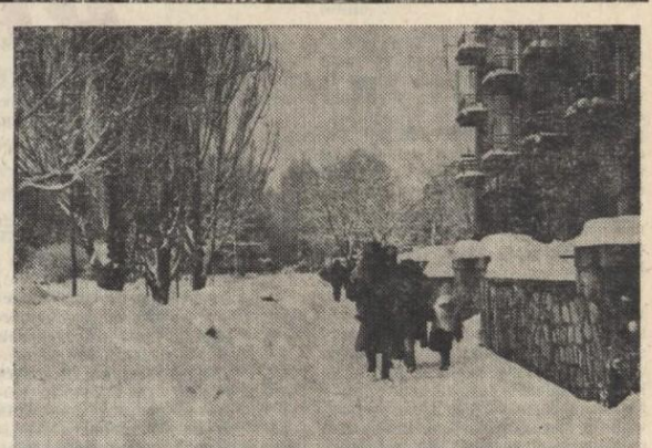
Czy będzie taka zima?

Śliskie nawierzchnie ulic to najczęściej ostatnio zgłaszane sprawy. Problemy z dojściem do WSK, nieposypane schody to temat, który można ciągnąć w nieskończoność. W ostatnim numerze gazety zgłaszaliśmy już nasze uwagi pod adresem osób odpowiedzialnych. Chciałabym jednak wrócić do sprawy już raz w gazecie sygnalizowanej, a mianowicie schodów prowadzących z ulicy Świerciewskiej do Przędowników Pracy. Konieczność zainstalowania barierki przy tym stromym zejściu, jest dla wszystkich tamtędy chodzących oczywista. Zupenie jednak nie chcą tego zrozumieć odpowiednie służby. Proponowałabym dla sprawdzenia, czy barierka jest potrzebna, czy też nie, sprowadzić rower lub dziecięcy wózek. Nie wspomnę już, że gospodarz tego terenu zupełnie nie oczyszcza schodów a nawet nie posypuje ich piaskiem. A może i dla niego chodzenie po tych schodach jest zbyt niebezpieczne. (as)