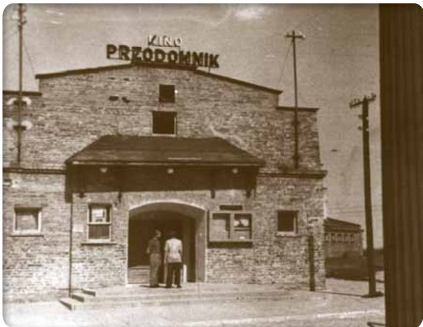
Pierwsze kino Przodownik Przodownik Cinema, the first cinema in Świdnik