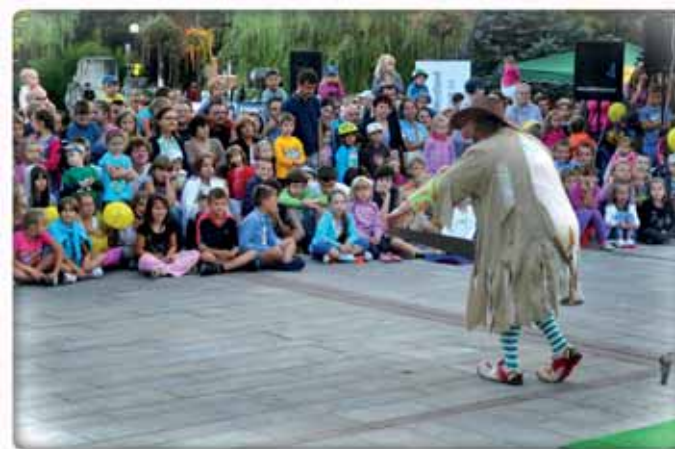
Plac Konstytucji 3 maja