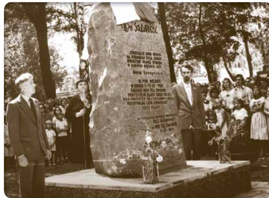
Odświeżenie pomnika w I rocznicę wydarzeń Świdnickiego Lipca, 1981 r. Unveiling of a Monument during the first anniversary of Świdnik's July, 1981

Sit-in strike of Factory 13th December 1981