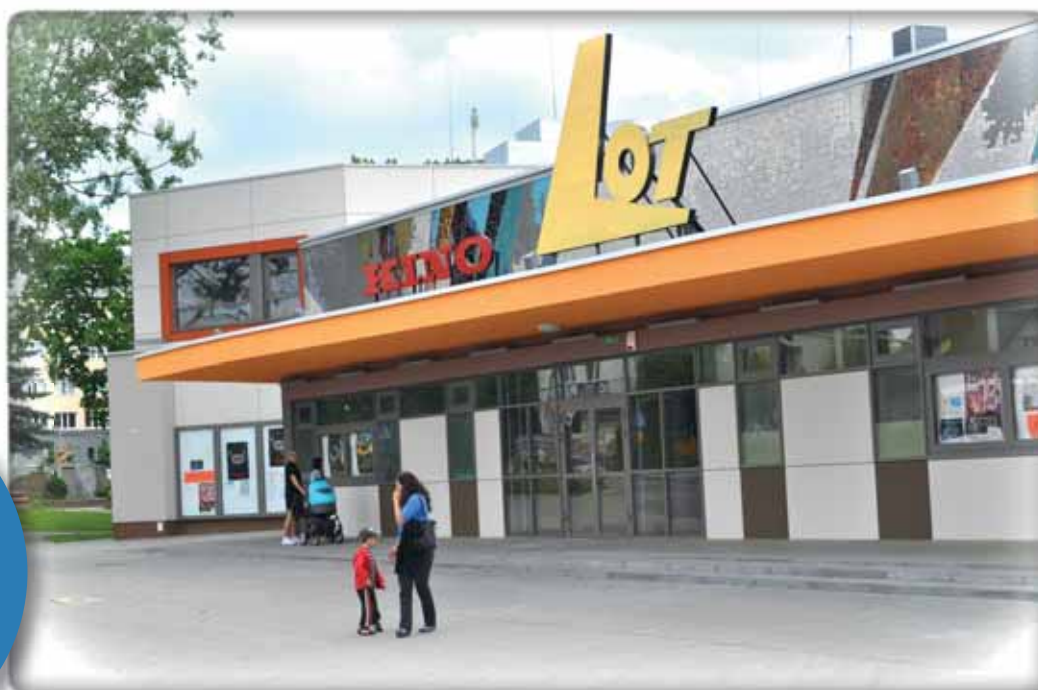
Centrum Kultury Centre of Culture