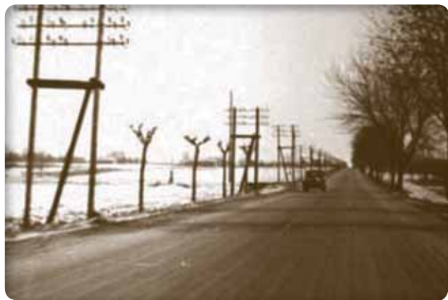
Wygląd drogi do miasta w latach 50. XX w.