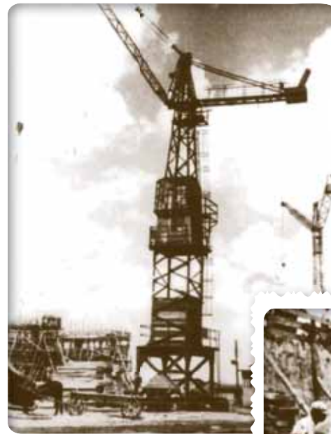
Budowa Wytwórni Sprzętu Komunikacyjnego Building of WSK (Transport Equipment Factory)