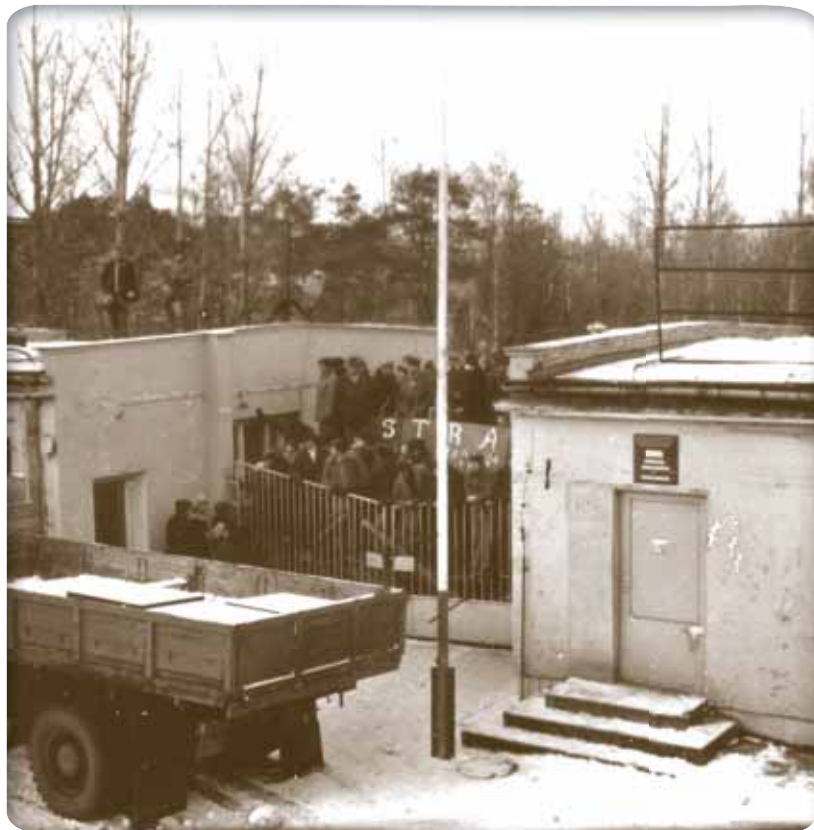
Strajk okupacyjny zakładu 13 grudnia 1981 r.

Sit-in strike of Factory 13th December 1981