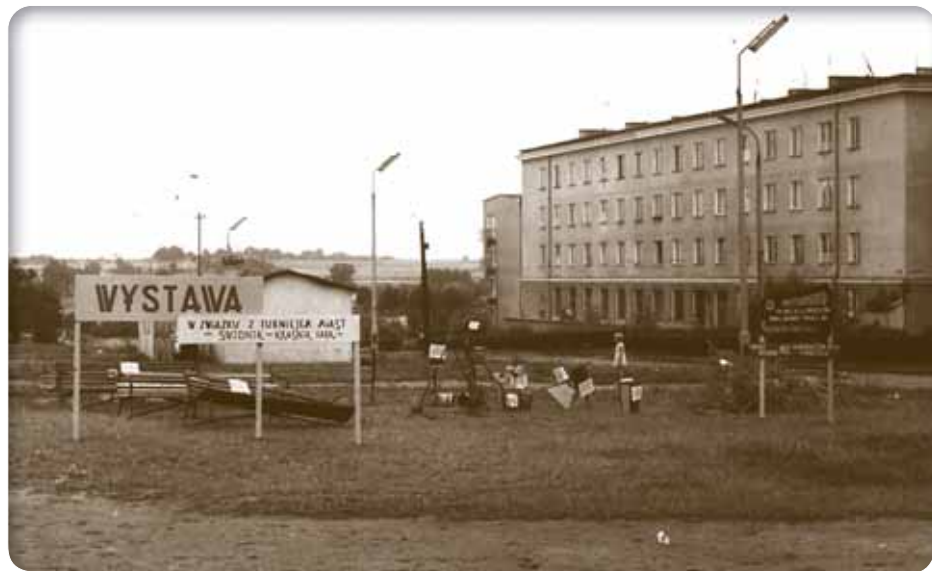
Plac Konstytucji 3 maja Constitution of May 3 Square