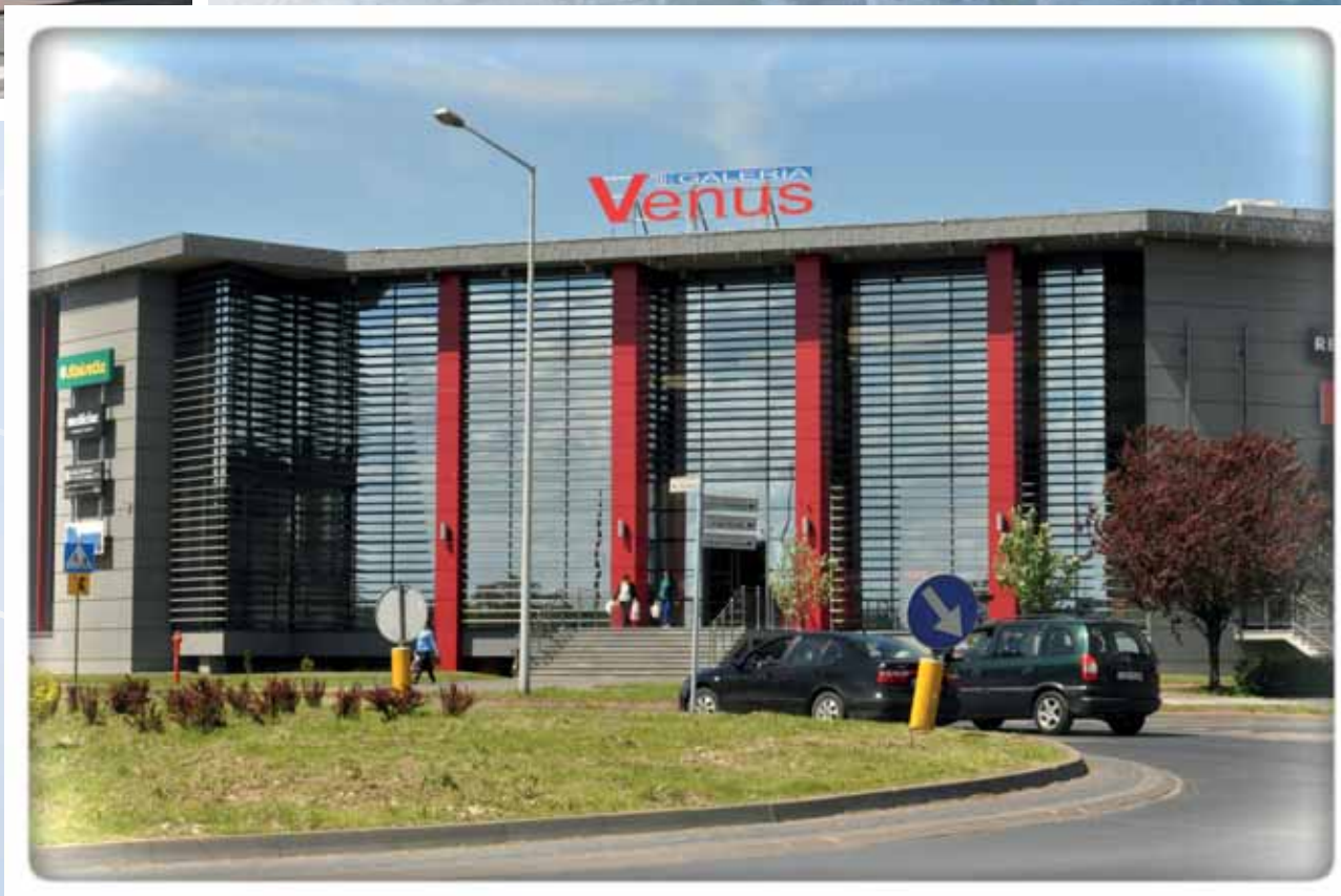
Centrum handlowe „Venus” Venus Shopping Mall