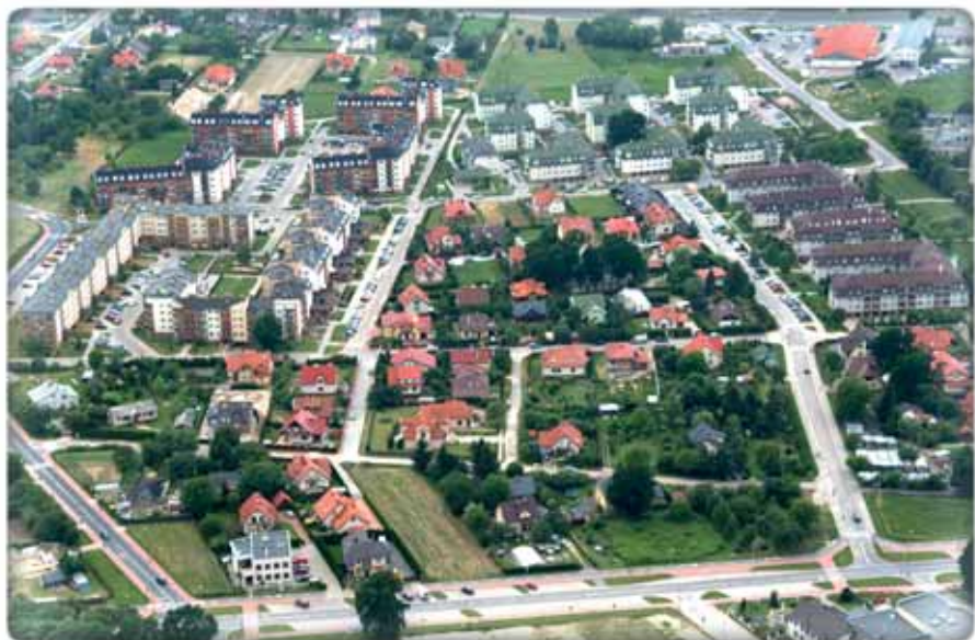
Osiedle w południowej części miasta Estate in the south part of the city