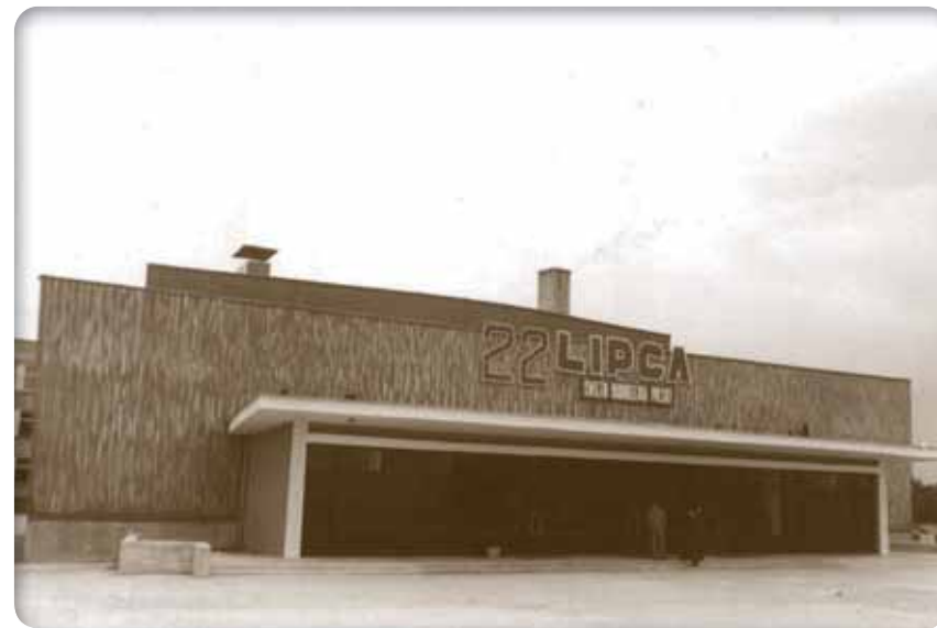
Kino Lot Lot Cinema