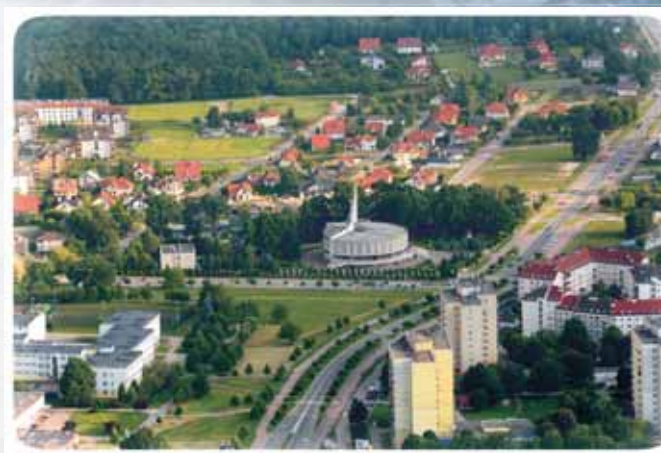
Kościół pw. NMP Matki Kościoła

Church of Saint Mary, Mother of The Church