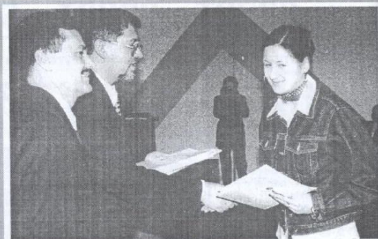
Najlepsi uczniowie, wzorowi społecznicy