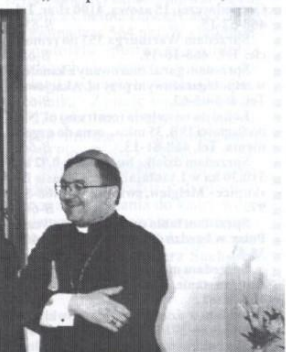
Podczas wizyty w Ośrodku Dostojny Gość obejrzał wystawę prac powstałych w ramach warsztatów terapii zajęciowej.