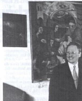
Podczas wizyty w Ośrodku Dostojny Gość obejrzał wystawę prac powstałych w ramach warsztatów terapii zajęciowej.

Jedno z pomieszczeń zostało przeznaczone na kaplicę, w której odbywają się nabożeństwa, uroczystości religijne, rekolekcje, spowiedzi. Opiekę duszpasterską nad Schroniskiem sprawuje z upoważnienia ks. dziekana ks. Sławomir Mazurek. Efektem jego pracy było, między innymi, przystąpienie kilku podopiecznych do neokatechumenatu. Kontakt na płaszczyźnie religijnej z mieszkańcami schroniska ułatwia i to, że wychowawcy są również członkami tegoż ruchu, a obecny kierownik ukończył prawo kanoniczne w Katolickim Uniwersytecie Lubelskim.