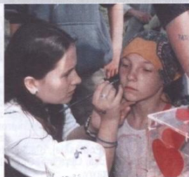
Tylko 50 groszy kosztowało pomalowanie twarzy w fantazyjne wzory. Chętnych nie brakowało.