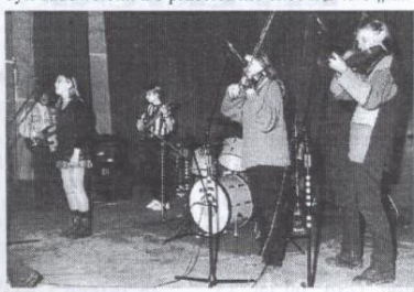
Laureat III miejsca - zespół BEZBULU.