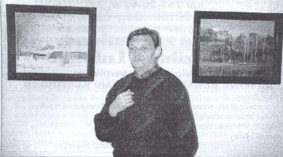
Autor na tle swoich prac.

larza. Autor doskonale wie dlaczego maluje i na czym polega istota malarstwa. Zręcznie operuje kolorem i z łatwością wydobywa za jego pomocą