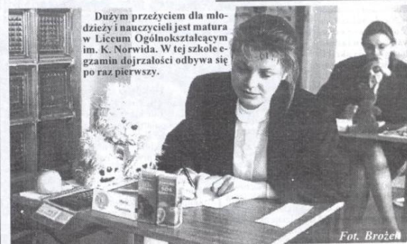
Dużym przeżyciem dla młodzieży i nauczycieli stał się egzamin w Liceum Ogólnokształcącym im. K. Norwida. W tej szkole egzamin dojrzałości odbywa się po raz pierwszy.