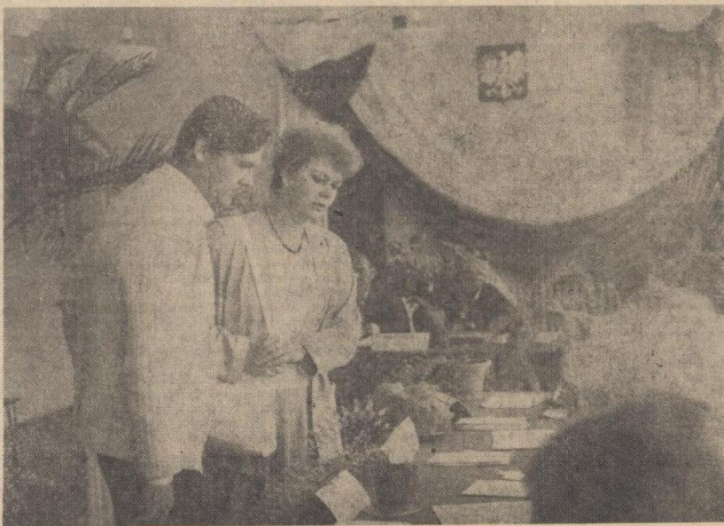
W niedzielę, 19 czerwca wybraliśmy w Świdniku nową Miejską Radę Narodową. W środę, 29 czerwca radni odbyli pierwszą sesję.

Komunikat Miejskiej Komisji Wyborczej o przebiegu i wynikach głosowania do MRN zamieszczamy na str. 3 i 4