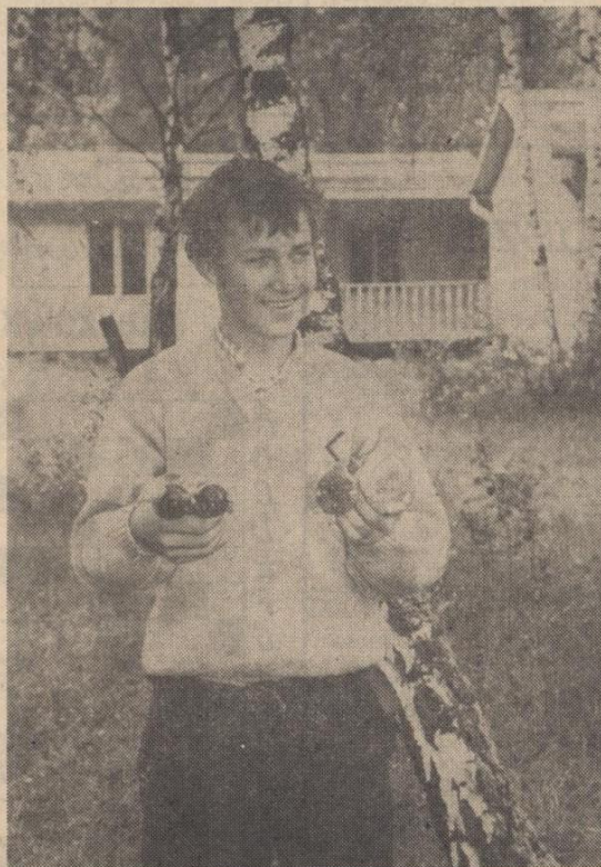
Póki co nie rozpieszcza pogoda, co jednak nie przeszkadza grzybiarzom w zbieraniu borowików ani bocianom w zakładaniu rodzin.